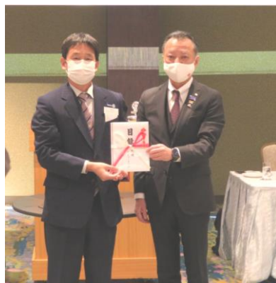
岡崎RC奨学基金より国際交流事業に対して補助金の贈呈式