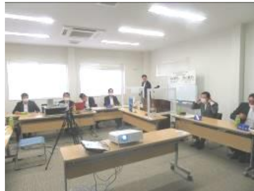
(株)ホンダカーズ三河 本社にて ZOOM 配信リモート例会