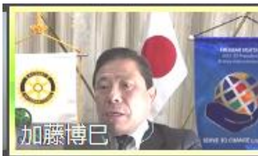
完全リモート例会