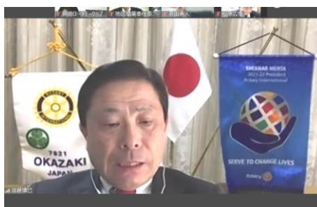
加藤会長司会によるリモート例会